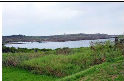
圖 6 菜園濕地