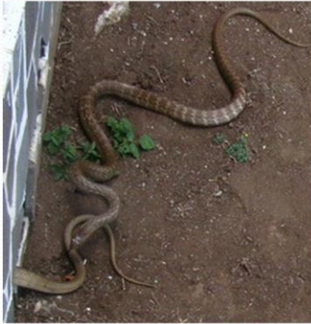
上. 中. 左下: 南蛇. 右. 右下: 蝎虎 中下: 斑龜