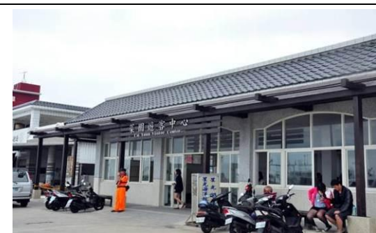
圖 7 菜園遊客中心(候船室)