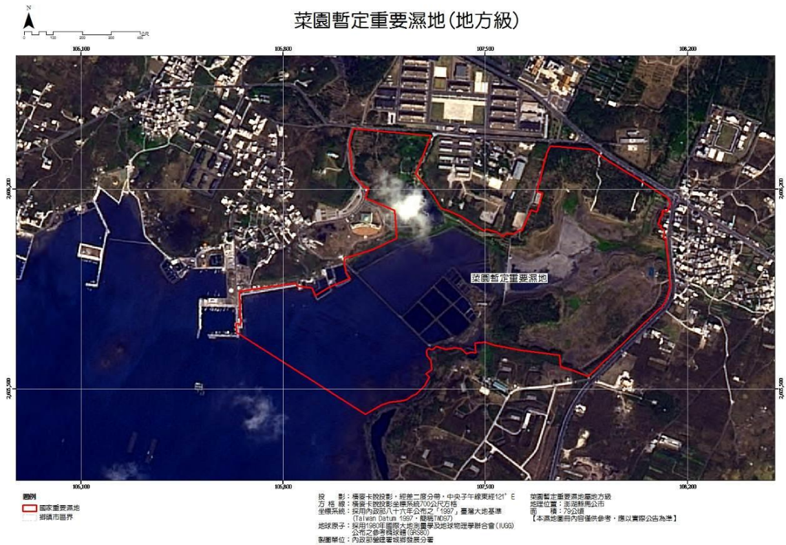
圖 1 菜園暫定重要濕地原公告範圍圖