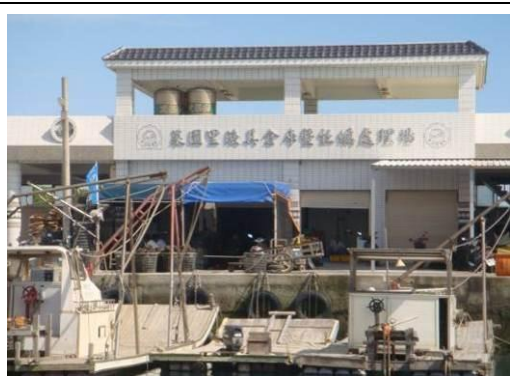
圖 4 牡蠣處理場

菜園里轄內居民早期均以務農為主，直至政府倡導蚵業養殖，居民才慢慢投入該項事業，全盛時期約有五分之一人口從事蚵業養殖，同時創造商機進而帶動地方建設。此外在政府、業界及居民共同努力下菜園里成為了菜園休閒漁業園區，陸續投入公共設施建設，健全整體環境，結合菜園濕地以建構完善的生態教育場所。菜園里因地勢較低，水源充沛，土質肥沃。但目前耕作面積小從事農業的人口也不多，生產的農作物多以蔬菜為主，農作收成後除自家食用外，少部分在市場出售。