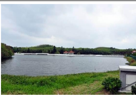
圖 5 雙湖園