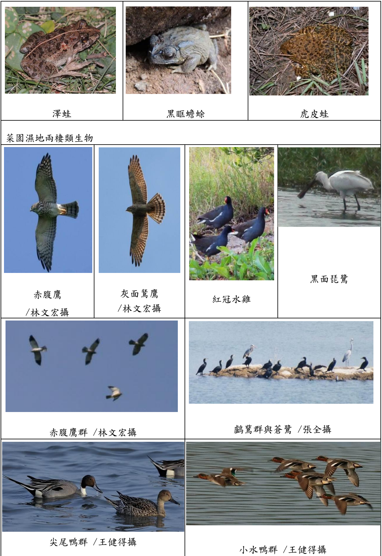
圖 8 菜園濕地重要鳥類