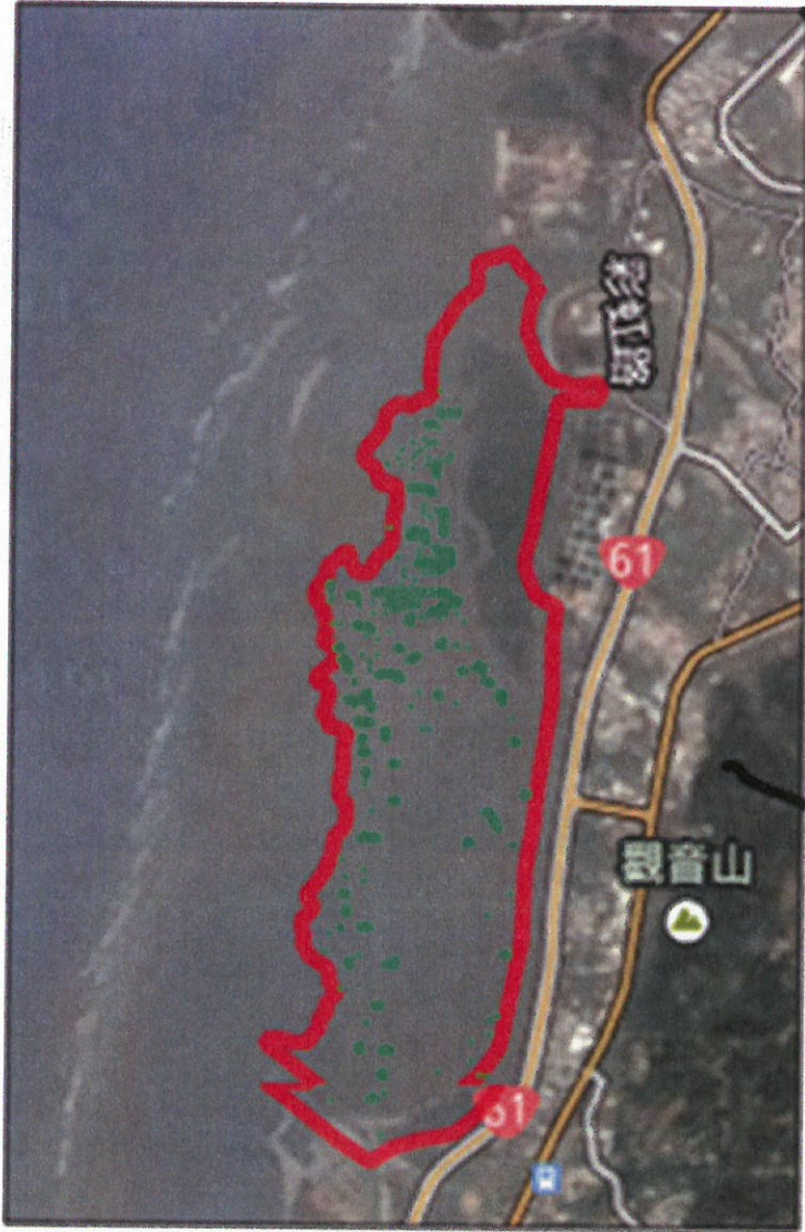
圖 1.香山濕地紅樹林清除計畫範圍(紅框範圍內)。