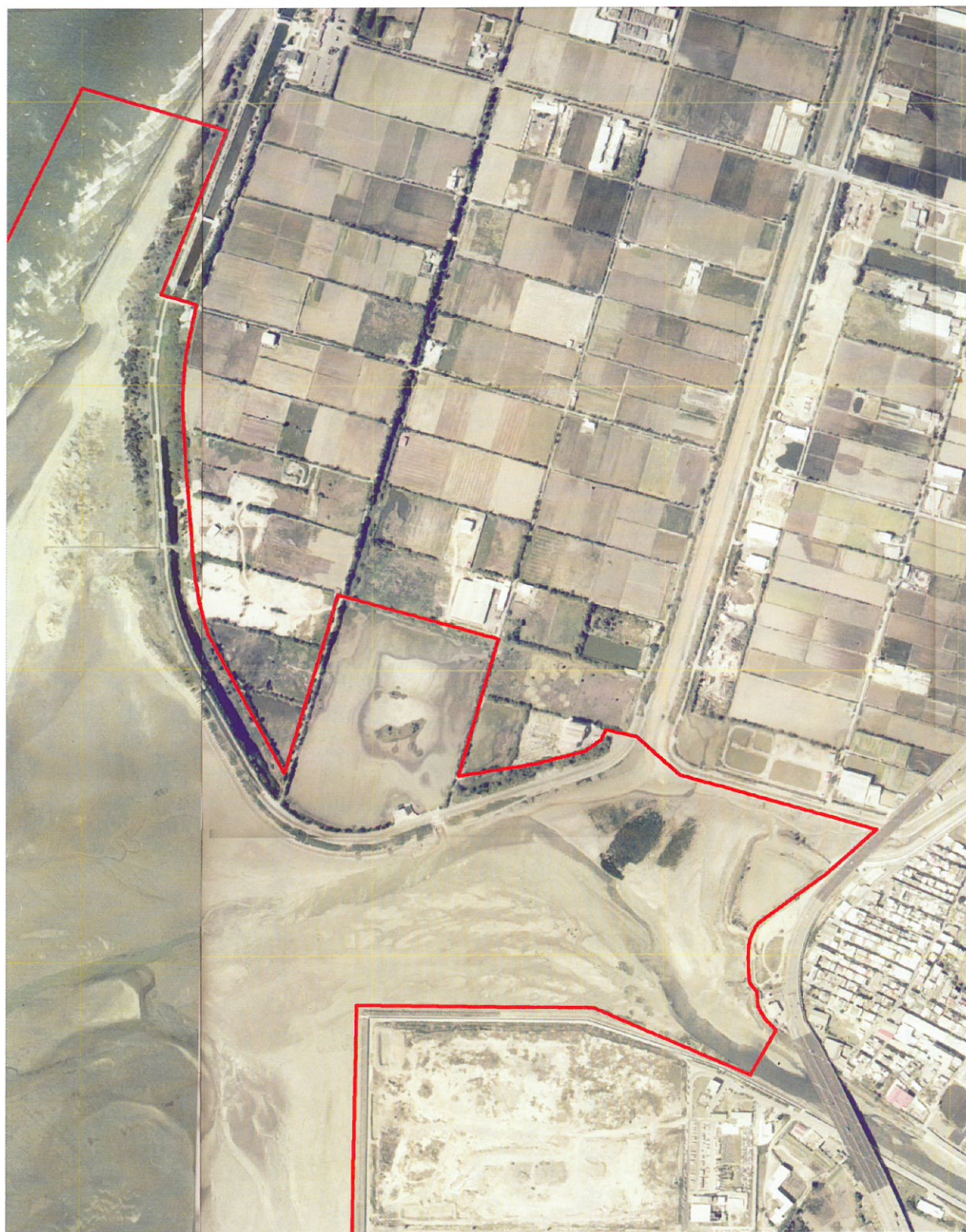
圖一之一：北界及客雅溪口