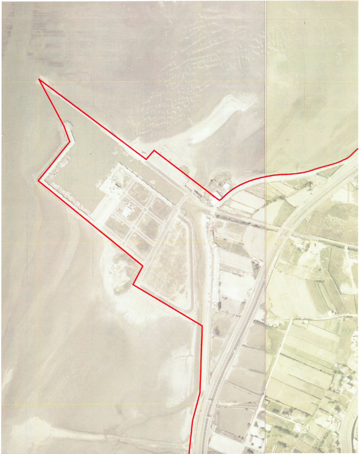
圖一之二：海山漁港