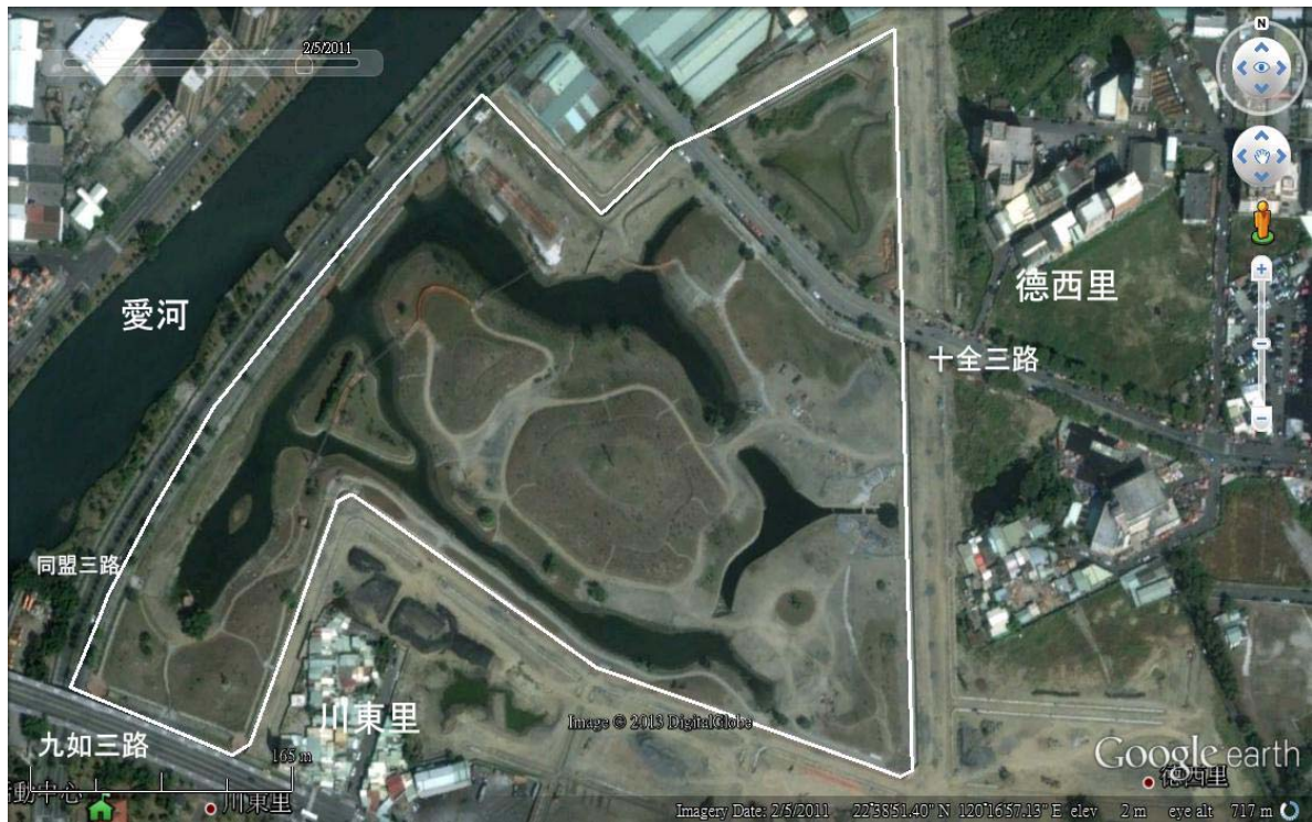
圖 1 中都濕地位置圖